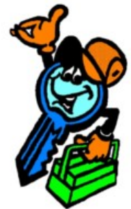
« SOS SERRURE LEROY »