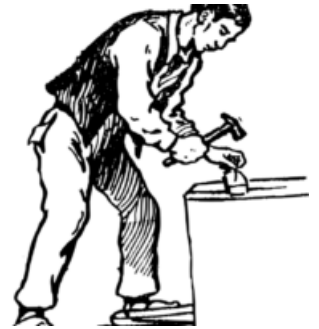
« RBAT MENUISERIE »