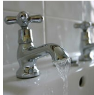
« POZZOBON »