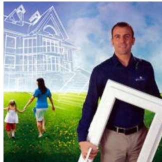
« OUVERTURE N2F »