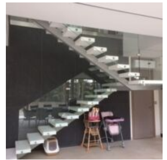
« FACINOR »