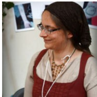
« GRÜNDBERG ART »